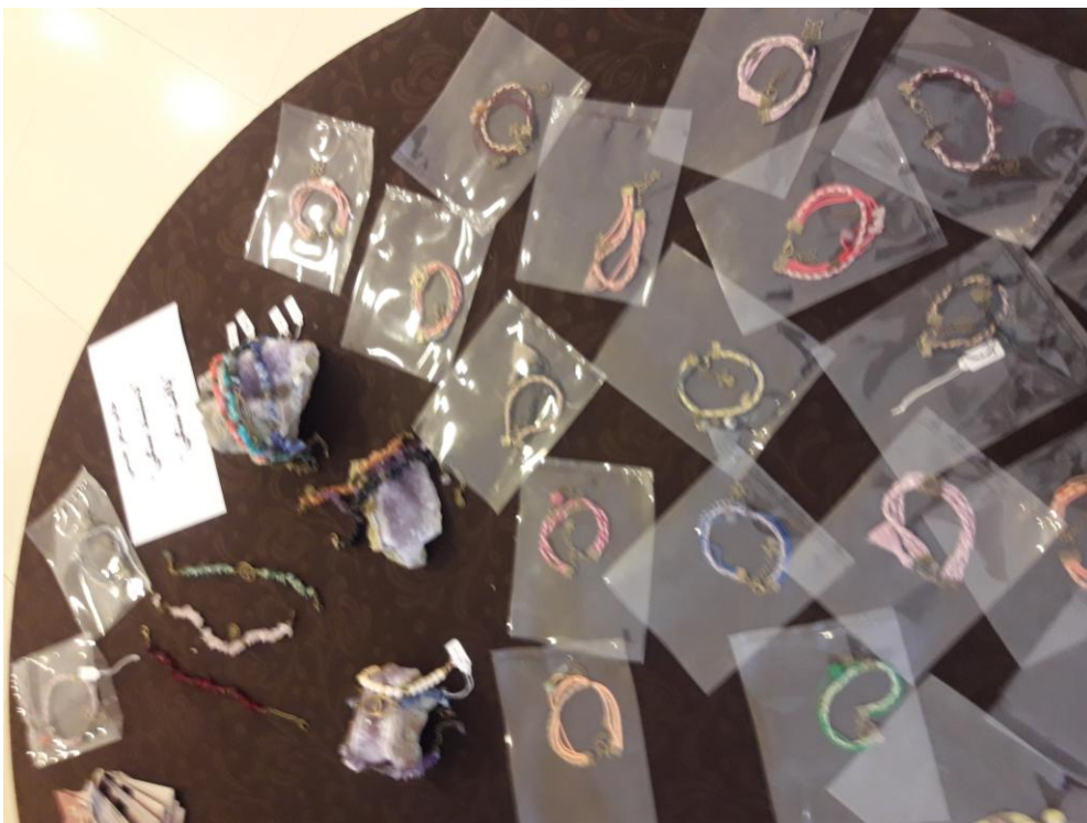
خانم ندا قشلاقی از معاونت آب، ابنیه و محیط زیست: چرم دوزی و خطاطی