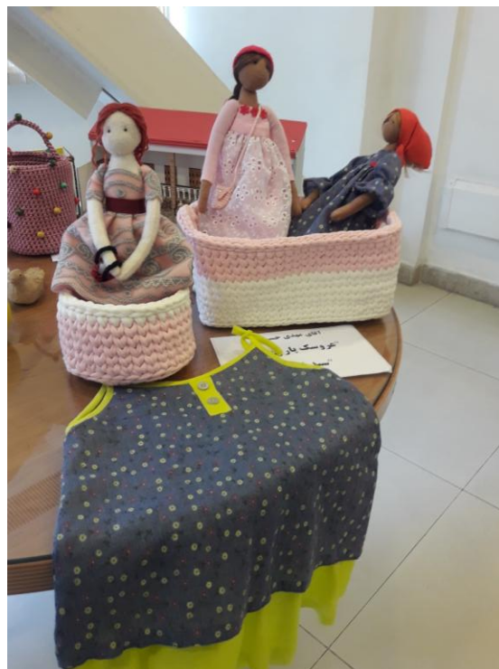
آقای سعید خضرزاده از معاونت پستهای انتقال: ماکت خانه و سفالگری، ویترای (فرزندان)